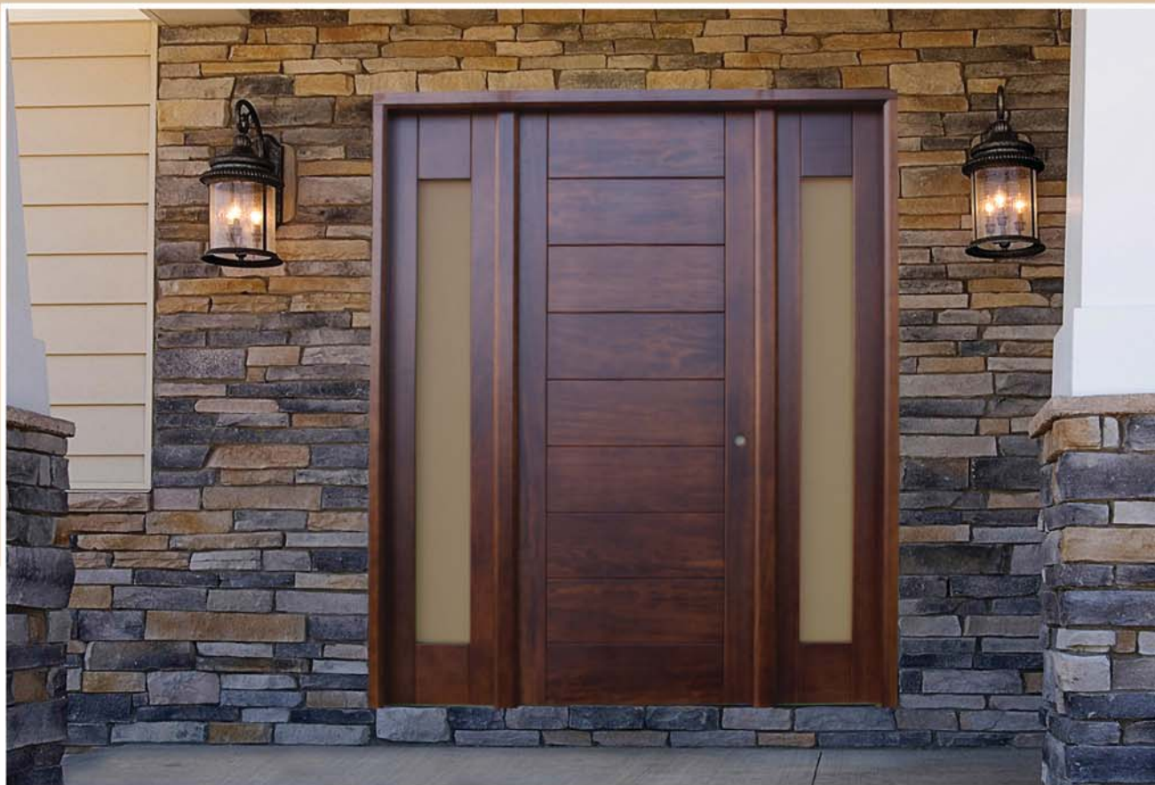
Block n°3-mod. 110/113